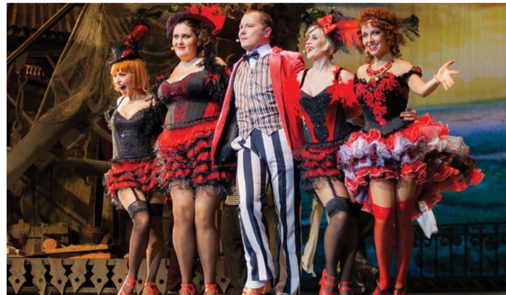
Мюзикл «Однажды в Одессе»