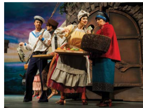
Мюзикл «Однажды в Одессе»

ствию данного оборудования предъявляемым требованиям: качественная равномерная цветовая заливка, мощность, цена, гарантия.