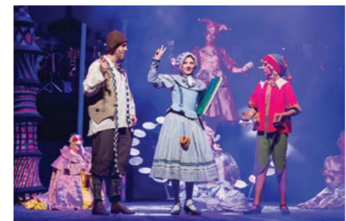
Спектакль «Буратино» – TINY CX, RADIO REMOTE UNIQUE 2.