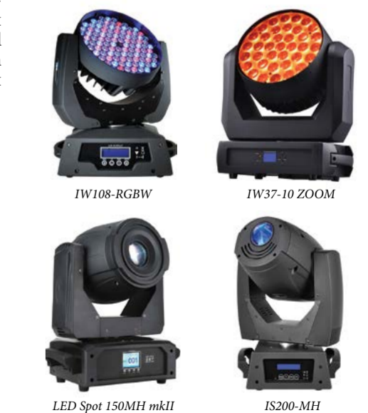
LED Spot 150MH mkII

Динамические головы: IW37-10 ZOOM, IW108-RGBW ZOOM, IW108 RGBW, IS200-MH, IS90-MH, LED Spot 150MH mkII.