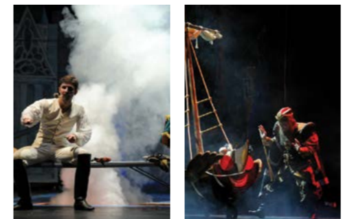
Спектакль «Огниво» – Viper 2.6 на системе подвеса HANGING SET FOR VIPER, рабочая высота 8 м.