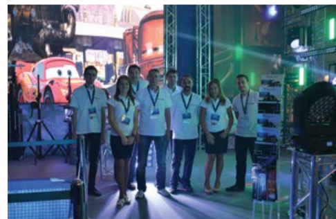
Сцена Show Atelier на выставке Prolight + Sound NAMM Russia, 09.2014

Что изменилось за эти годы? Из семейного стартапа компания Show Atelier превратилась в одного из лидеров российского рынка по поставке профессионального оборудования для технического обеспечения мероприятий event-индустрии. Show Atelier сегодня – это надежный, зарекомендовавший себя партнер для тысяч частных компаний и государственных учреждений во всех регионах России. Show Atelier – это компания с постоянно пополняемым складом оборудования, отделом продаж и логистики, финансовым отделом и собственным сервисным центром послепродажного обслуживания. Show Atelier – это полноценная, самостоятельная и сплоченная команда профессионалов, задача которой остается неизменной – сделать отечественный рынок event-индустрии более инновационным, стабильным и качественным.