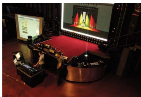
Технический семинар JANDS VISTA в клубе Shine, июнь 2014

Если Вы или художники по свету Вашего театра захотите стать участниками наших технических семинаров, пожалуйста, пришлите заявку на электронную почту sad.nenashev@gmail.com и мы обязательно Вас пригласим!