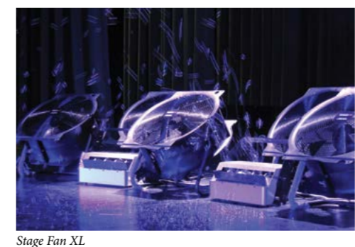
Stage Fan XL