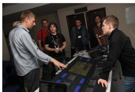
Технический семинар в рамках выставки PROLIGHT+SOUND NAMM Russia, май 2013 г.